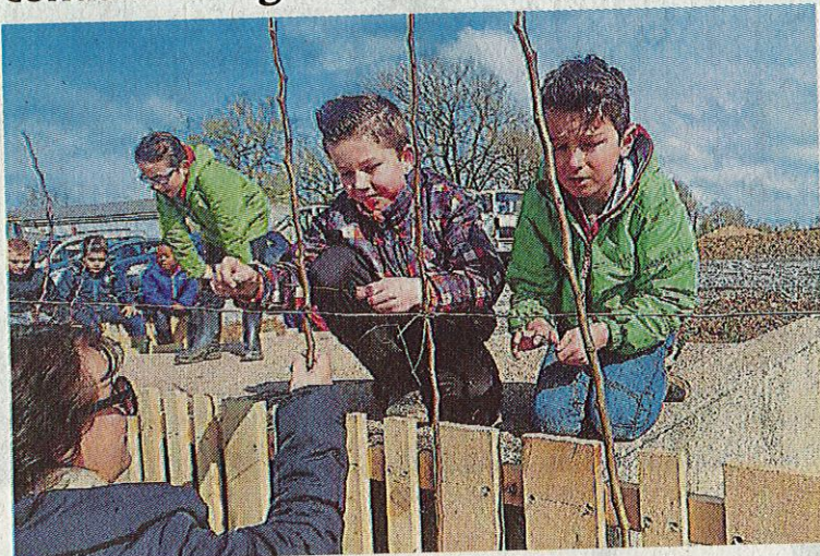
L'art d'attacher les poiriers conduits en palmette sur les fils de fer.

Vendredi, les enfants de l'école Saint-Joseph ont participé au troisième et dernier volet du projet « Plantation du verger pédagogique » à l'espace paysager, entre la salle du foyer rural et la salle multi-activités.