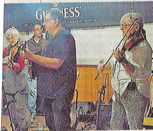
er la soirée de la Saint-Patrick.

une soi- Une invitation est lancée au club de parquet, salsa ! roposée.