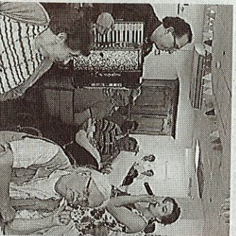
Le groupe La Roulotte s'est glissé entre les tables pour servir la musique au plus près des résidents.

Cette année, le groupe La Roulotte a assuré un long régal de chansons anciennes, des années vingt, qui a rappelé des souvenirs aux nombreux convives, une centaine de personnes s'étant jointe aux résidents pour ce repas exceptionnel. Ça et là ils ont repris en cœur les refrains, et certains se sont même essayés à quelques pas de danse dans les espaces laissés libres entre les tables.