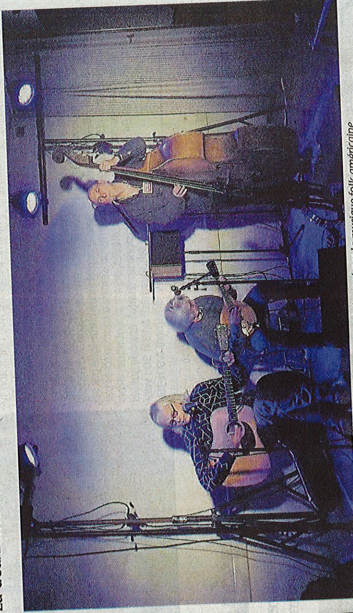
Le groupe Sigrove Stompers, composé de trois Gâtinais, est influencé par la musique folk américaine.

La deuxième édition des Transes-Gâtinales a eu lieu samedi au Foyer rural.