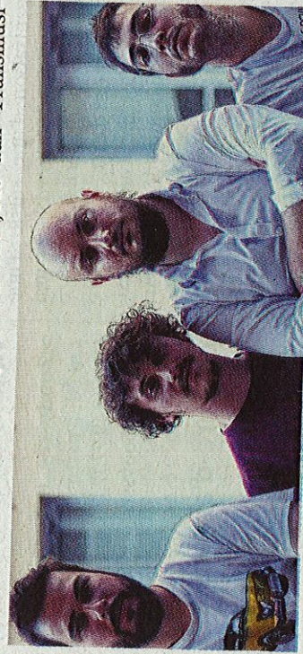
Les Auvergnats de Super Parquet associent avec goût instruments traditionnels et musique électro.

> Révélés par le voisin rennais. Les Auvergnats de Super Parquet seront présents lors des Transes-Gâtinales. Révélation du Printemps de Bourges, ils ont joué aux Transm-