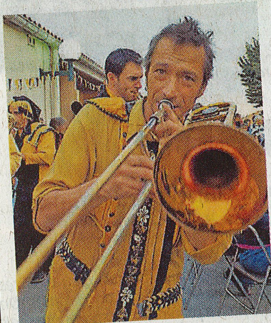
La fanfare de l'Étrange Gonzo a proposé plus de 20 minutes de musique en début de soirée.

En partenariat avec la municipalité et l'association des Arts p'tits culteurs, le Collectif Gonzo a eu carte blanche, vendredi 7, au soir. Malgré un public un peu frileux, les spectateurs présents ont bénéficié d'une Sortie de chantier bien orchestrée.