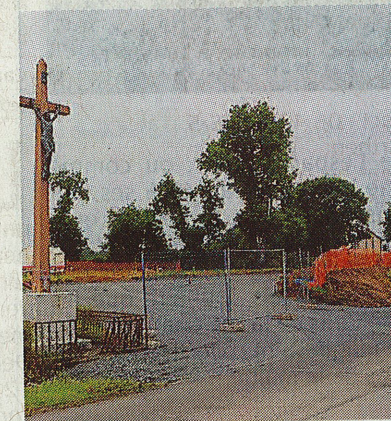
Les travaux de terrassement sont terminés, route de Parthenay.

Loyers communaux : un peu comme un gag, le Conseil a pris acte de l'évolution de l'indice officiel des