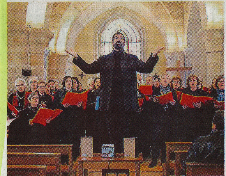
La Croche Chœur et ses registres variés dans l'église Saint-Saturnin.

A noter que l'ensemble est venu récemment au Palais des congrès interpréter les chœurs célèbres et, en 2014, « Starmania ».