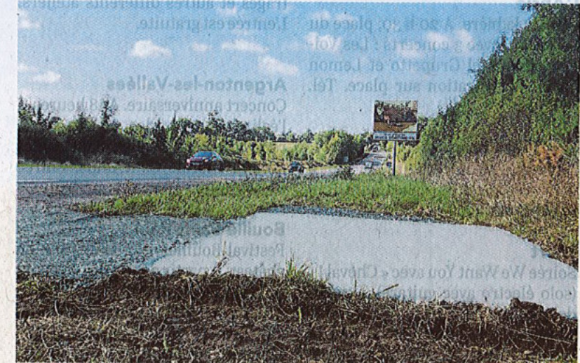
Au moins deux plateformes bétonnées comme celle-ci a été construites le long de la trois voies qui relie Niort et Parthenay, en Deux-Sèvres.

Du côté de la préfecture, impossible d'obtenir une réponse à l'heure où nous publions ces lignes. « Je n'ai pas