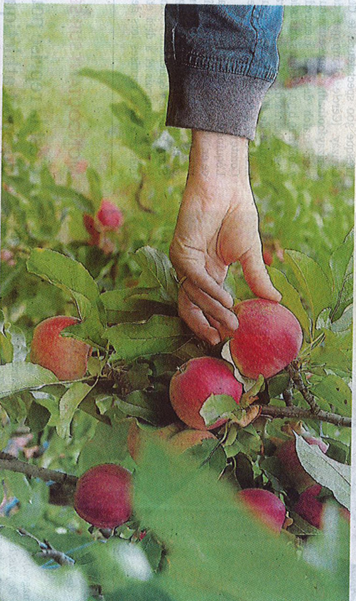
Un recensement des pommiers et poiriers oubliés va être entrepris en Gâtine en septembre et octobre.

Le programme régional Nature et Transition (NET) vise à faire émerger et soutenir des initiatives et des actions dont l'objectif principal est la préservation et/ou la restauration de la biodiversité. Soutenues par la région Nouvelle-Aquitaine, les thématiques abordées sont multiples : continuité écologique, restauration des milieux, plans d'action trame verte et bleue, innovation, expérimentation. Les bénéficiaires de l'appel à projet varient selon la fiche action concernée, notamment :