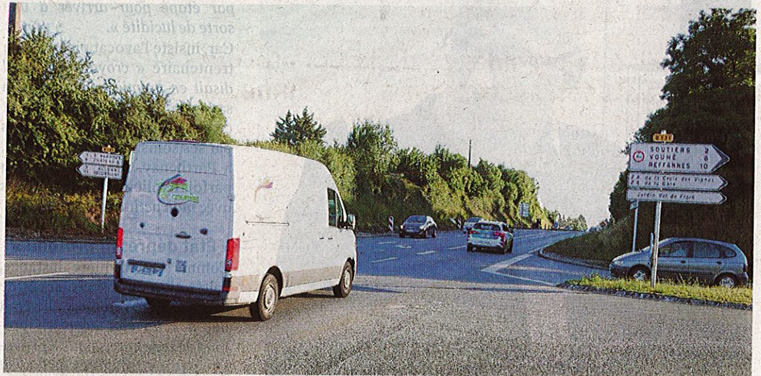
C'est sur le carrefour de la Croix des Vignes que s'est déroulé, mercredi 7 juillet, une collision entre deux voitures, qui a coûté la vie à une passagère de 83 ans.