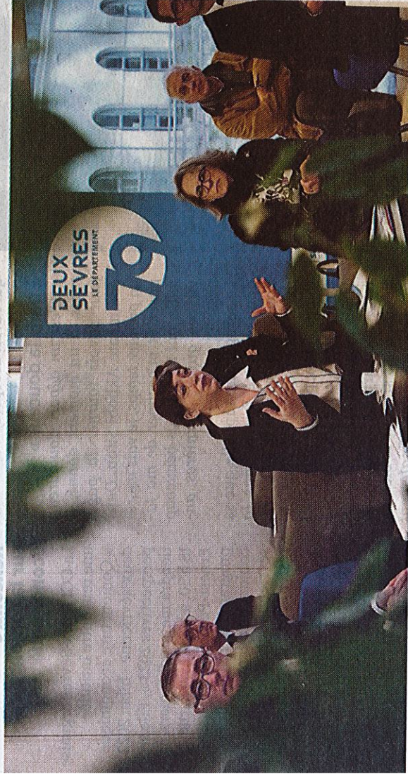
Coralie Dénoués, présidente du conseil départemental, le 3 février 2023, lors de la présentation du plan collège 2050.

Bientôt des éléphants blancs en plein cœur de la Gâtine ? Coralie Dénoués, la présidente du conseil départemental, promet que ce ne sera pas le cas. Le collège de L'Absie, qui doit fermer en 2024, « bénéficiera d'une reconversion totale ».