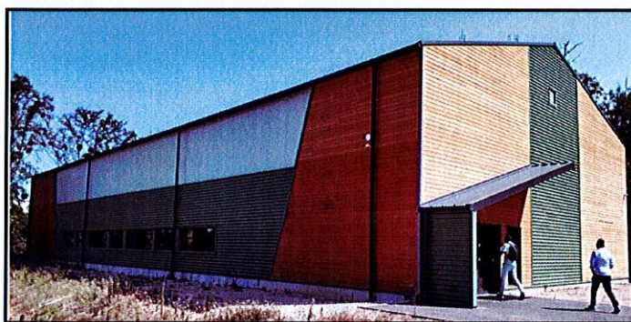
Exemple de structure réalisable par Solutech

Le bureau municipal a effectué plusieurs visites de constructions de halles des sports, dont la maîtrise d'œuvre a été confiée à des entreprises ayant répondu à la consultation lancée par la Municipalité.