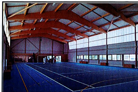
Exemple de structure réalisable par Archimag